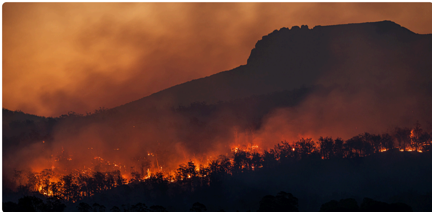
Utsläppen och konsumtionen måste minska totalt sett på planeten.