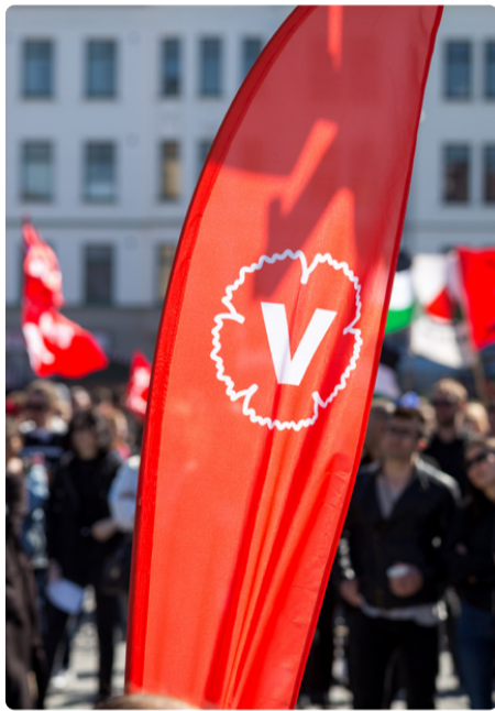
1 maj har alltid varit en dag för protester, men också en dag då arbetare kunnat tillåta sig att drömma.

Åtta timmars arbetsdag 1884 bestämde sig ett fackförbund i USA för att åtta timmars arbetsdag skulle bli verklighet. När åttatimmarsdagen ännu inte var nådd den första maj 1886, trappades protesterna och strejkerna upp. Tre dagar senare, den 4 maj, skedde det som kom att kallas Haymarketmassakern i Chicago. Poliserna försökte stoppa en arbetardemonstration och någon kastade en bomb. Minst ett dussin människor dödades, när polisen började skjuta