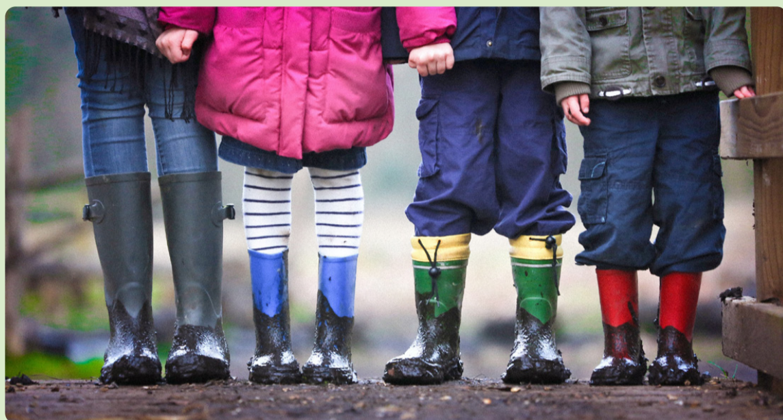
Vinstjakten driver friskolorna att sortera bort icke lönsamma elever, så som elever med särskilda behov.

Vissa områden lämpar sig inte för den fria marknaden. I Sverige tillåter vi att marknaden utarma vårt gemensamma bygge i vården, skolan och omsorgen. Målet är vinstmaximering för ägarna. Ägare som ofta utgörs av multinationella och skrupelfria riskkapitalbolag.